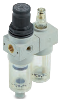
BIT : Lichtgewicht, in kunststof, reeds tientallen miljoenen verkocht