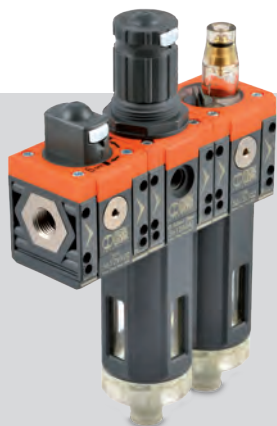
SYNTESI : De eerste serie met verwisselbare draadaansluitingen