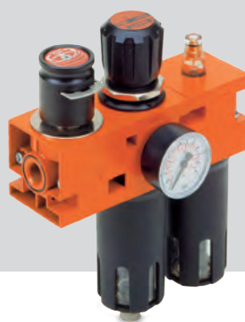
NEW DEAL : Metalen behuizing voor "heavy duty" toepassingen